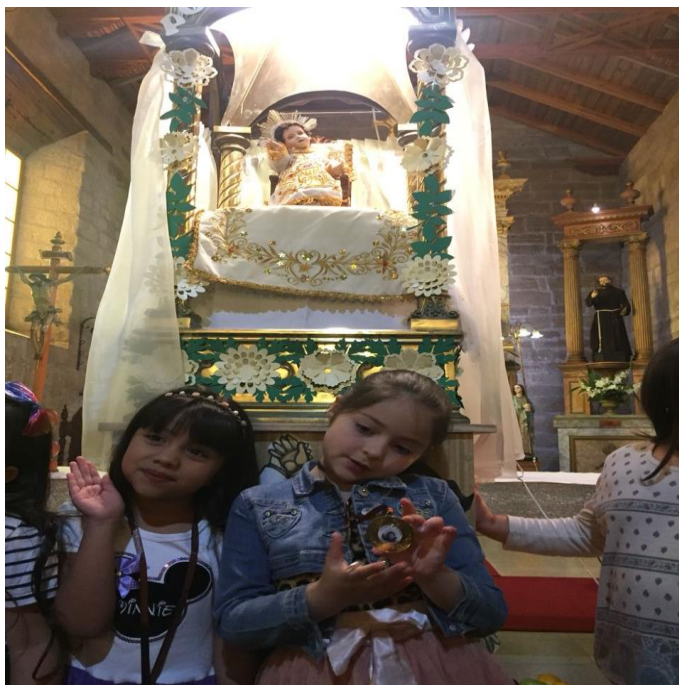
Consagración al Niño Jesús de los alumnos de kínder a cuarto año básico

Nos hacemos entonces el propósito como Comunidad Escolar de seguir por esta senda, viviendo y fortaleciendo los valores del hermano franciscano y de San Antonio de Padua: