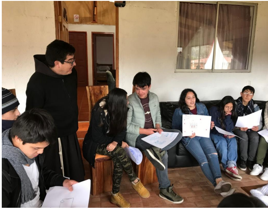
Retiro de Pre –Jufra en la Localidad de Hinojales, ruta 41 guiados por nuestro Capellán y los Monitores del movimiento.-

Como comunidad recibimos a la Virgen Peregrina de la Parroquia La Merced de La Serena con el objetivo de realizar un recorrido por los distintos lugares donde pueda estar nuestra querida Madre, a la cual todos sus hijos devotos le elevan oración en momentos de angustia o dolor.