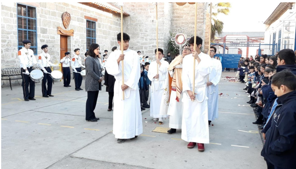
Visita de la custodia Peregrina visita realizada en todas las Diócesis de Chile