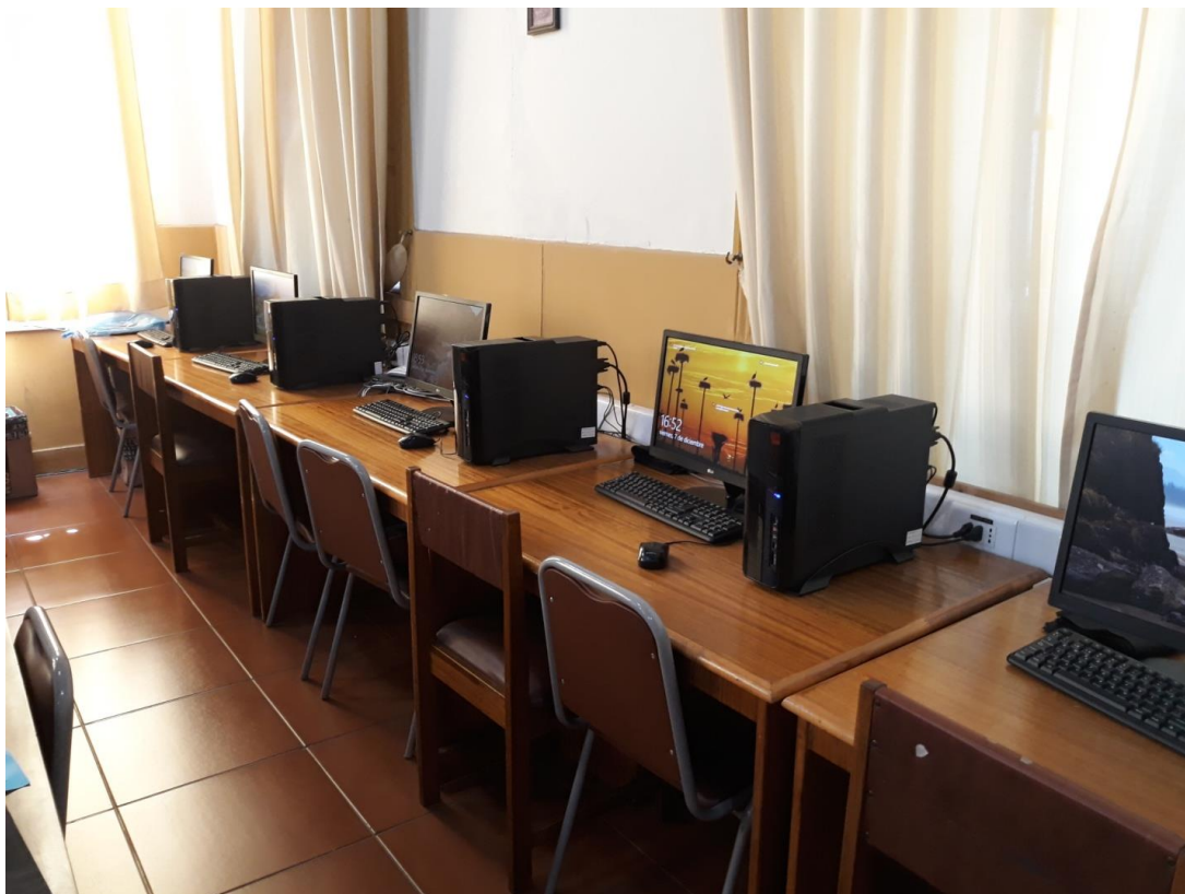
Cambio de todos los computadores de la sala CRA

Nuevo laboratorio de computación donde se hizo cambio de los 46 computadores, sillas y arreglo de todas las mesas.