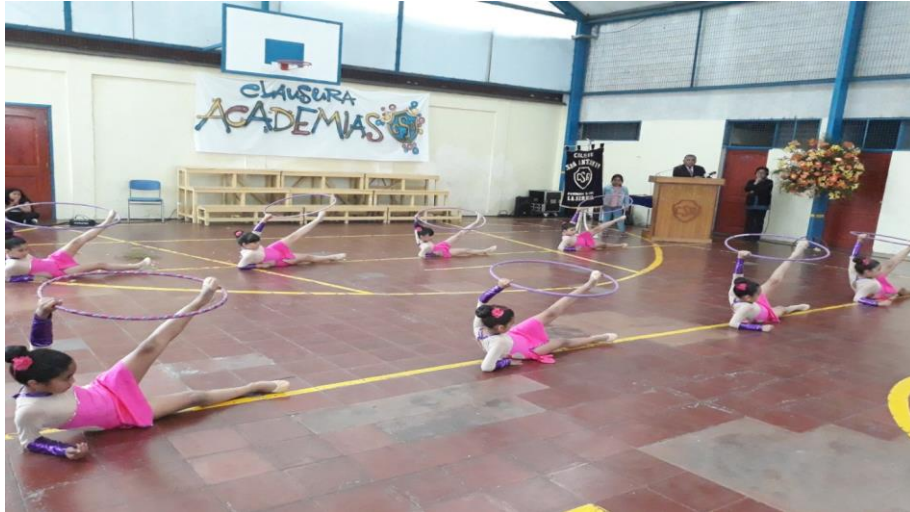
Presentación del grupo de Academia Rítmica en el acto de clausura