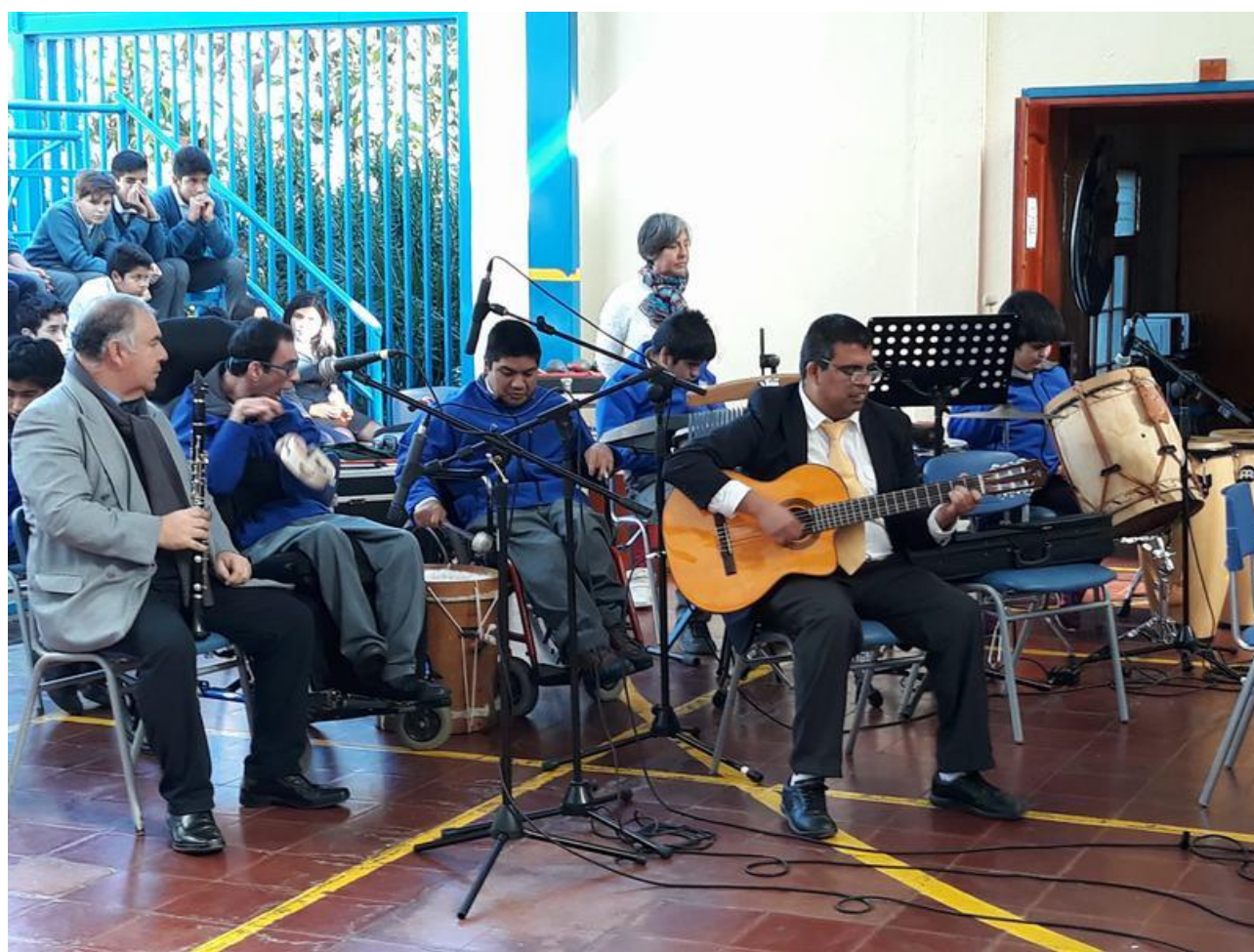
Participación de la Escuela Especial el día de la Inclusión Escolar