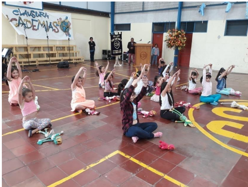
Presentación del grupo de Danza Contemporánea en la clausura de Academias