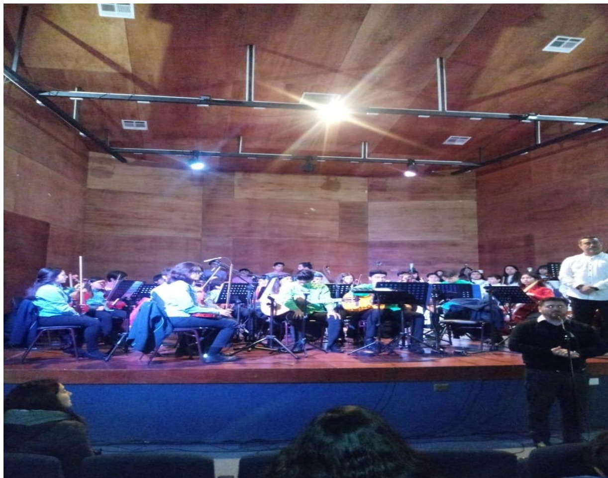
Presentación de la Orquesta Latinoamericana en el Salón del Colegio Salesianos de Valdivia

Importantes actividades ha desarrollado nuestra Orquesta Sinfónica Latinoamericana y los coros de San Francisco y de Santa Clara. Entre las presentaciones realizadas destacamos: