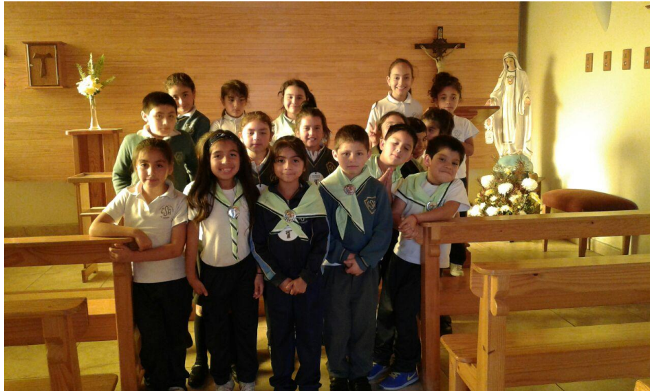
Actividades de Cofrani grupo perteneciente Mefrania