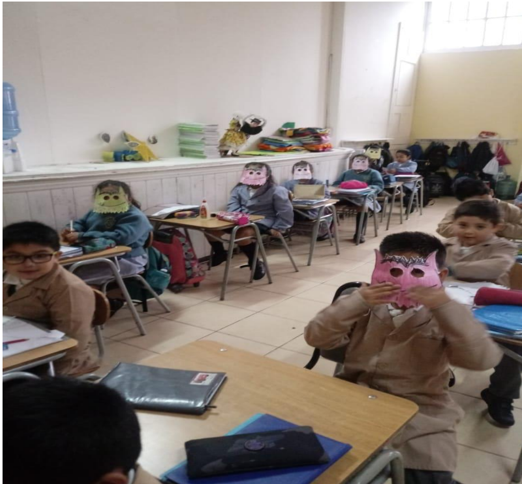
Desarrollo de talleres de habilidades sociales