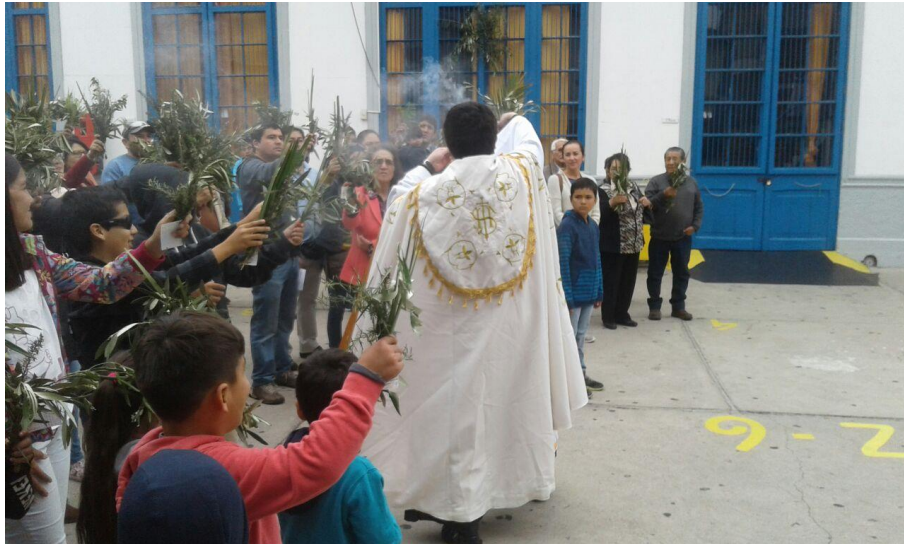
Inicio de Semana Santa, Domingo de Ramos

Se celebraron las fiestas franciscanas con gran entusiasmo y participación por parte de la comunidad, especial realce tuvieron las solemnidades de San Francisco, de San Antonio de Padua, Santa Clara, la Porciúncula, etc.