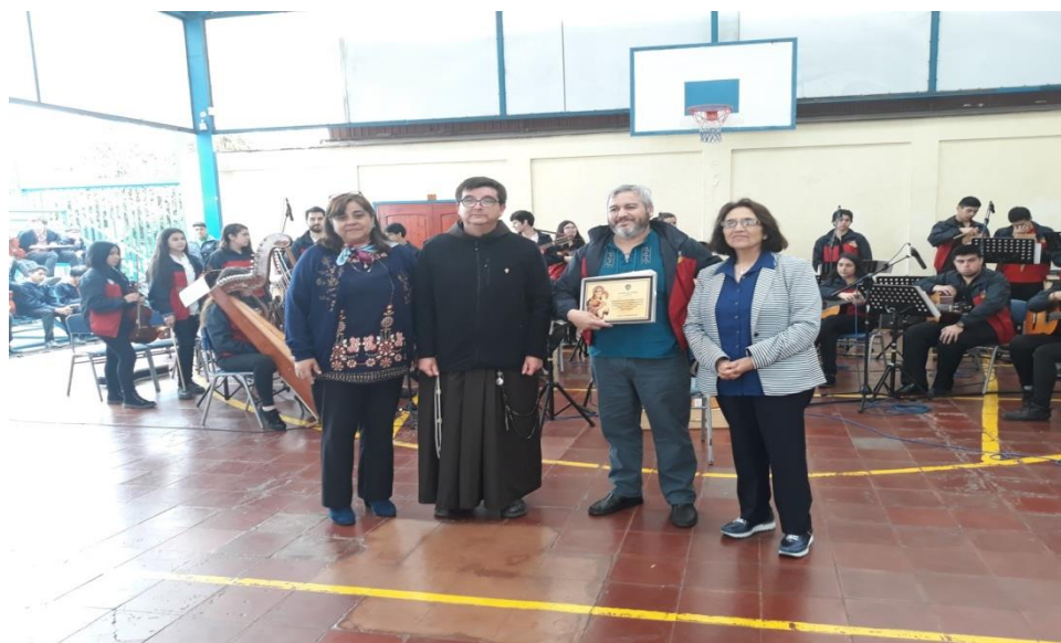
Entrega de un recordatorio al Director de la Orquesta de Lanco