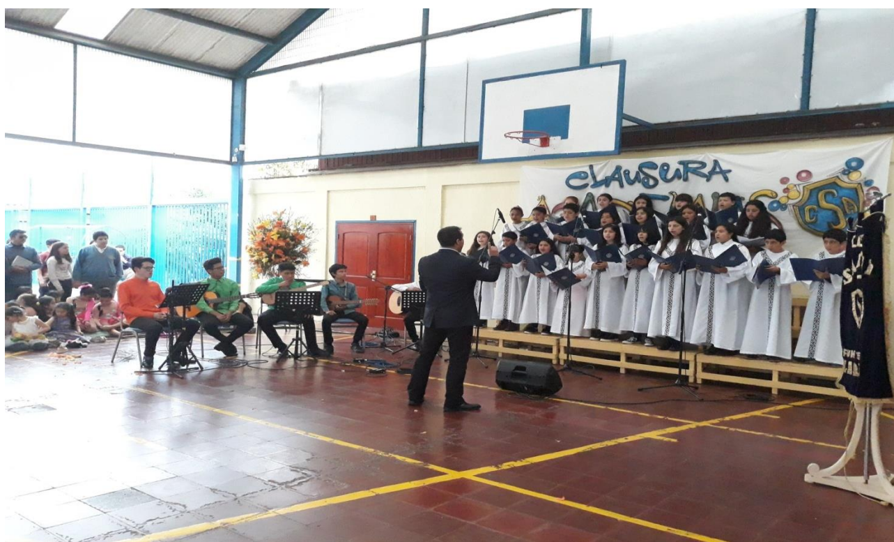
Participación del coro Santa Clara en la finalización de las Academias