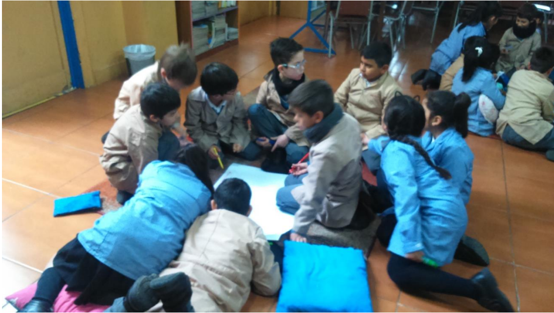
Desarrollo de talleres de habilidades sociales